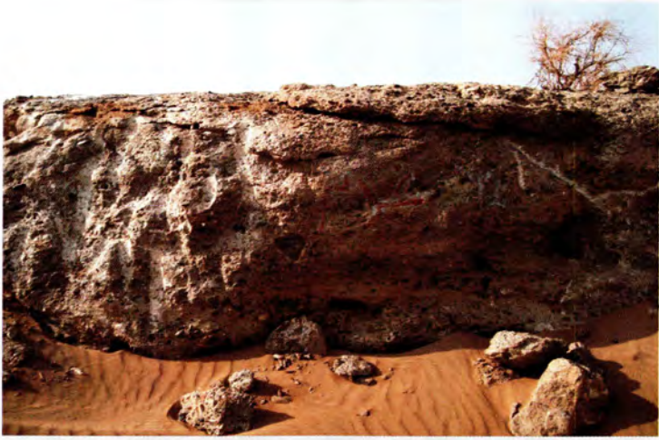
صورة قديمة لمكان الغدير