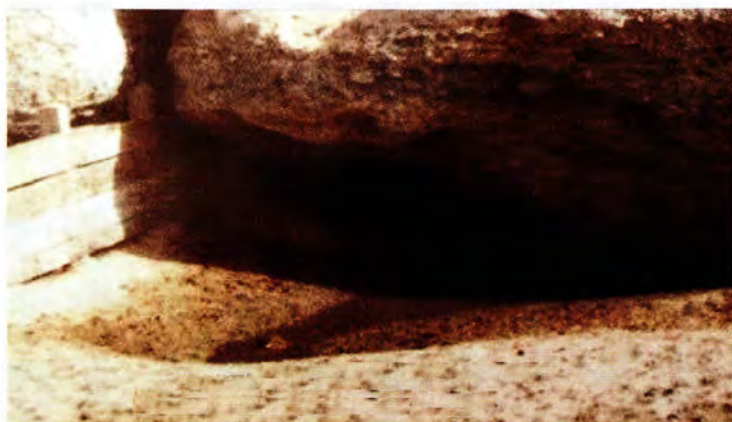
صورة قديمة لحوض الغدير