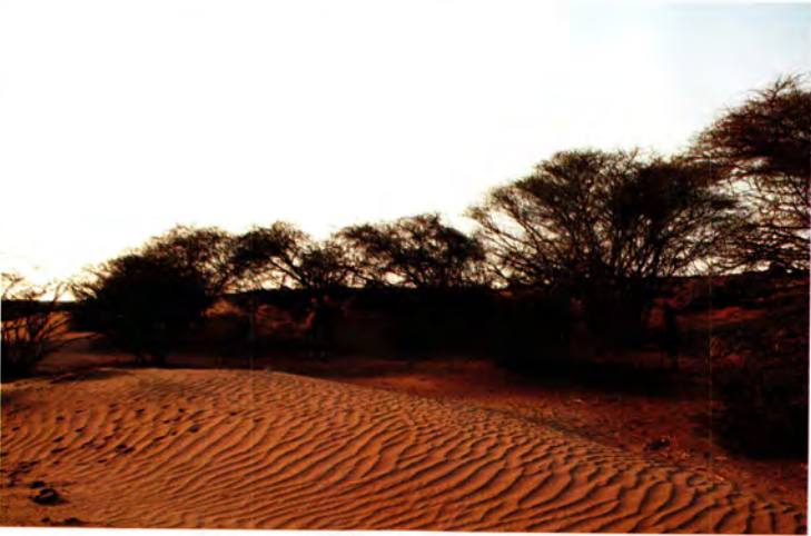
دوحات السمر حول غدير خم