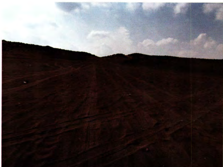
طريق القوافل القديم بين مكة والمدینة، ویسمى: طریق الأنبياء ویقع غدير خم شرق هذا الطريق