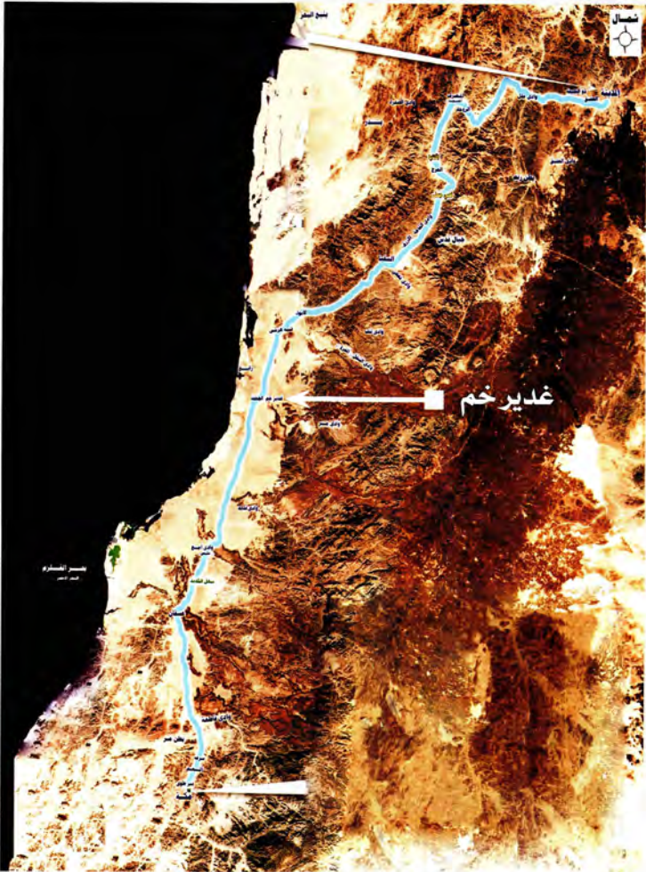
موقع غدير خم على طريق حجة الوداع