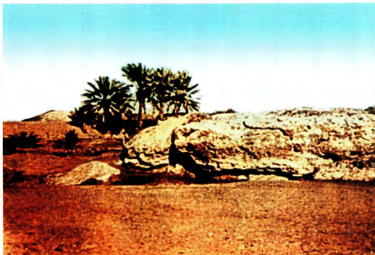
صورة قديمة لغدير خم