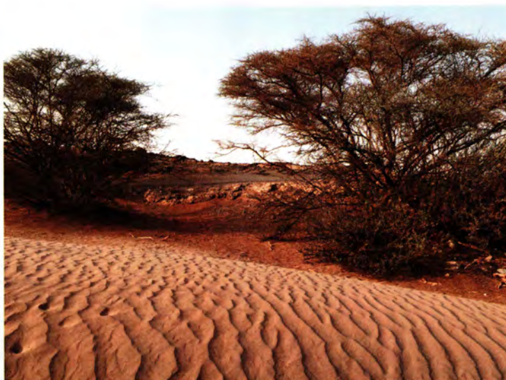
شجرات السمر في الوادي حول غدير خم، وقد خطب النبي صلى الله عليه وآله وسلم تحت شجرتي سمر