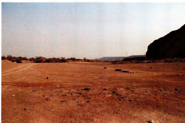
وادي الجحفة الذي یقع على شفيره غدير خم