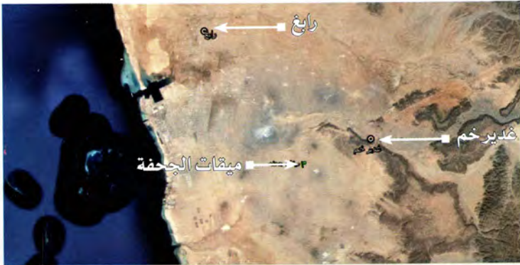
صورة جوية يظهر فيها غدير خم والجحفة