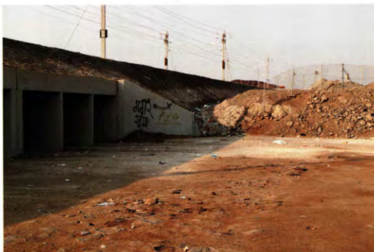
مكان الغدير على حافة جسر قطار الحرمين